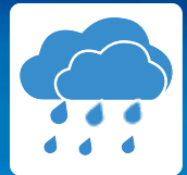
Regen & Feuchtigkeit